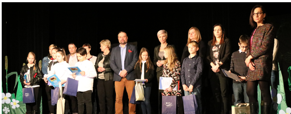
W ramach konkursu przyznano trzy główne nagrody i pięć wyróżnień. Oto laureaci, ich opiekunowie oraz wręczający nagrody.

Woda sama w sobie daje odpowiedź na pytanie o to, jak problemy z niedoborem tego cennego surowca można rozwiązać za pomocą natury. Dlatego hasło przewodnie tegorocznego Światowego Dnia Wody, który odbył się 22 marca, brzmiało „Natura dla wody”. Tradycyjnie już Przedsiębiorstwo Wodociągów i Kanalizacji Sp. z o.o. z Rudy Śląskiej zorganizowało z tej okazji konkurs plastyczny dla uczniów szkół podstawowych. Jego finał miał miejsce w Domu Kultury w Rudzie Śląskiej-Bielszowicach.