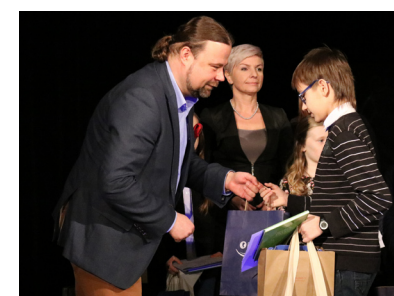
Nagrody wręczono także wyróżnionym.