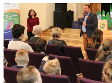
PWiK kolejny raz zorganizował finał konkursu w Domu Kultury Bielszowice.