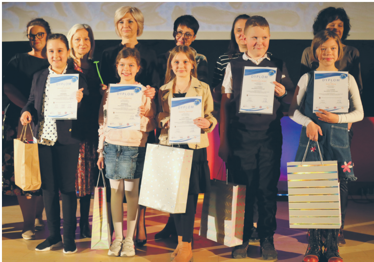
Komisja konkursowa przyznała w tym roku trzy nagrody główne oraz dwa wyróżnienia.

W tym roku uczestnicy konkursu mieli za zadanie wykonanie pracy plastycznej w dowolnej technice, związanej z ochroną środowiska wodnego oraz tematyką, czyli „Wody podziemne – nasz ukryty skarb”. – Muszę przyznać, że dzieci wykazały się dużą kreatywnością i w ciekawy sposób przedstawiły temat konkursowo-