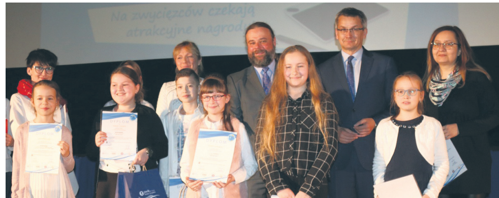
Oto zwycięzcy oraz wyróżnieni w konkursie wraz z opiekunami i wręczającymi nagrody.